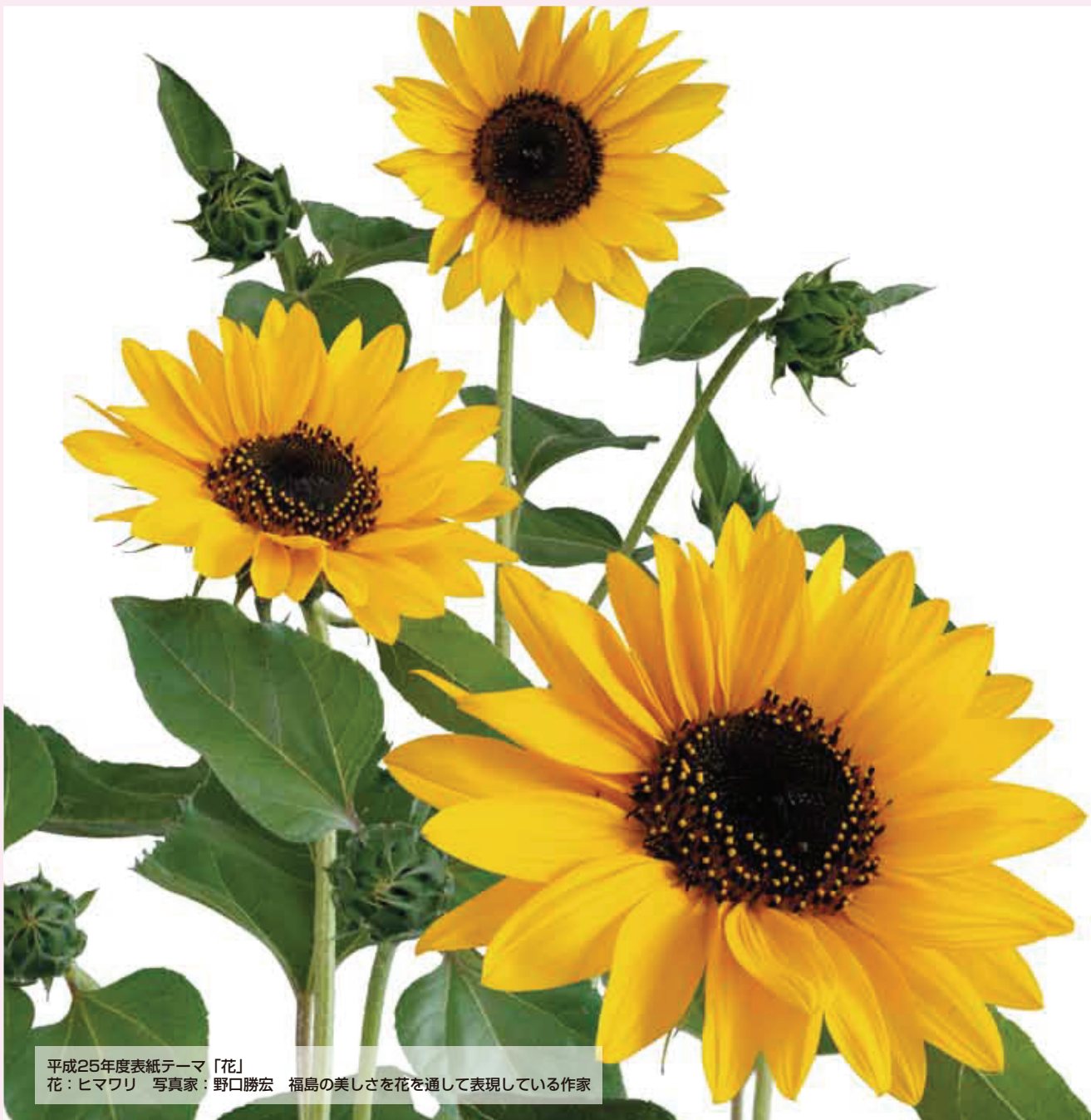
平成25年度表紙テーマ「花」 花：ヒマワリ 福島のみさを花を通して表現している作家