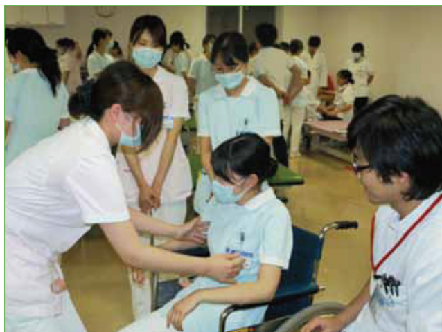
※看護師との移乗動作練習場面