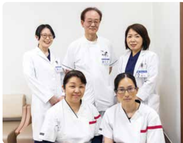
産婦人科医・麻酔科医・助産師