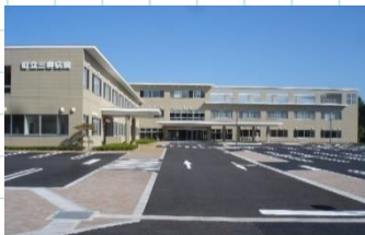
三春町立三春病院