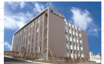
寿泉堂香久山病院