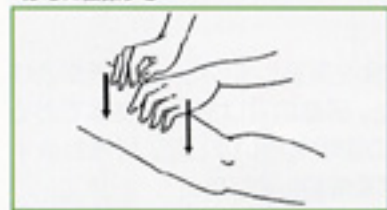
10 指頭叩打 指頭で交互に足全体を叩打する