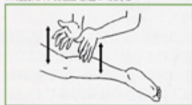
12 切打 伸ばした手の小指側で交互に足全体を叩打する