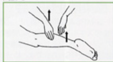
11 指頭叩打 指頭でつまむように足全体を叩打する