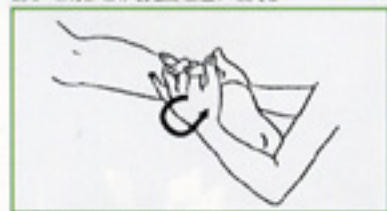
7 組み合わせ輪状強擦 両手を組み合わせてくるぶしを挟み、円を描くように強擦する