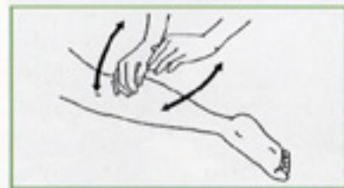
13 拍打 手掌で交互に足全体を叩打する