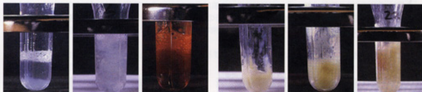
〈検査に適さない痰(唾液、血痰)〉

上記にも書いたとおり、結核菌の検出には良質な喀痰の採取がとても重要です。良質な喀痰とは、咳とともに出されたもので、唾液の混入ができるだけ少ない膿性の痰のことであり、水道水などで口をゆすいだ後に咳を誘発して採取します。