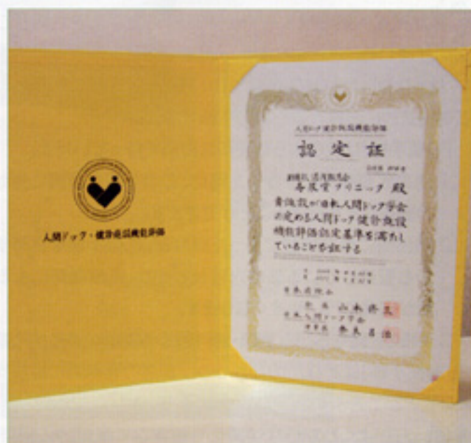
〈人間ドック・健診施設機能評価認定証〉