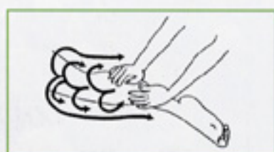
3 両手掌輪状軽擦 両手掌を交互にらせんを描くように大腿部まで滑らせ、両側面を通過して戻る