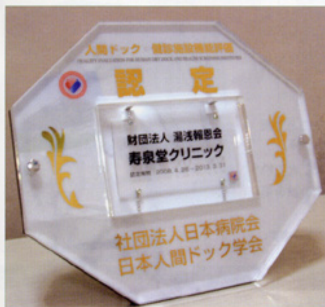
〈人間ドック・健診施設機能評価認定プレート〉