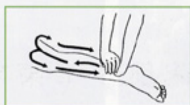
2 重手掌軽擦 両手を重ね、大腿部まで滑らせ、両側面を通過して戻る