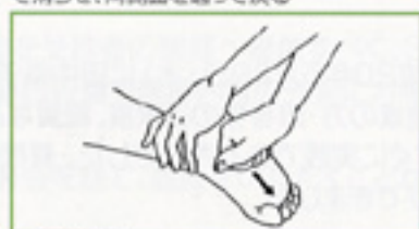
6 手拳強擦 こぶして足裏中央を強擦する