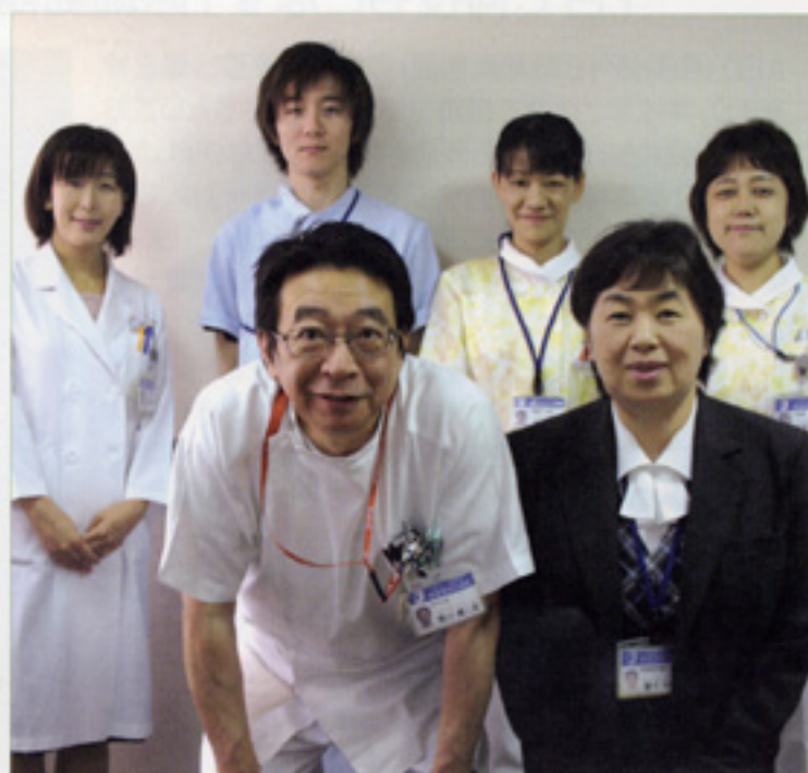
〈医療安全室スタッフ〉