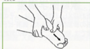
5 母指強擦 左右の母指で交互にかかつかから指先に向かって強くこする