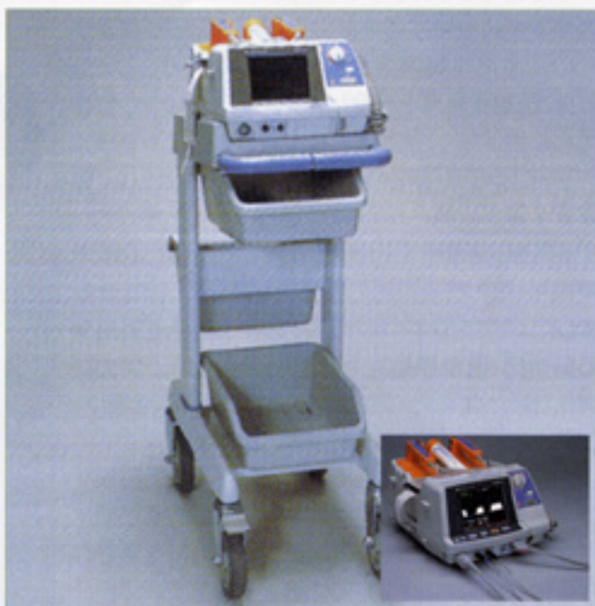
〈デフィブリレーター〉