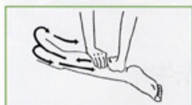
1 両手掌軽擦 両手を前後にそろえ、大腿部まで滑らせ、両側面を通過して戻る