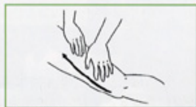
9 手掌軽擦 手掌で大腿部内側を交互に引き上げるように軽擦し、両側面を通過して戻る