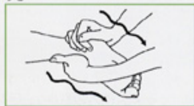
15 振せん 足首を持ち、軽く引っ張るように振せんし、ゆっくり離す