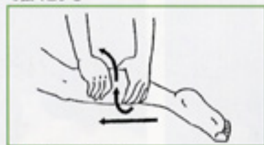
8 遠従性両手掌揉捏 左右の手で交互にねじるように大腿部まで揉捏する