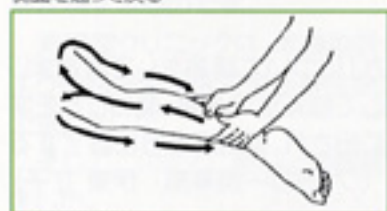
4 両母指軽擦 親指を平行にそろえ、軽く圧迫するように大腿部まで滑らせ、両側面を通過して戻る