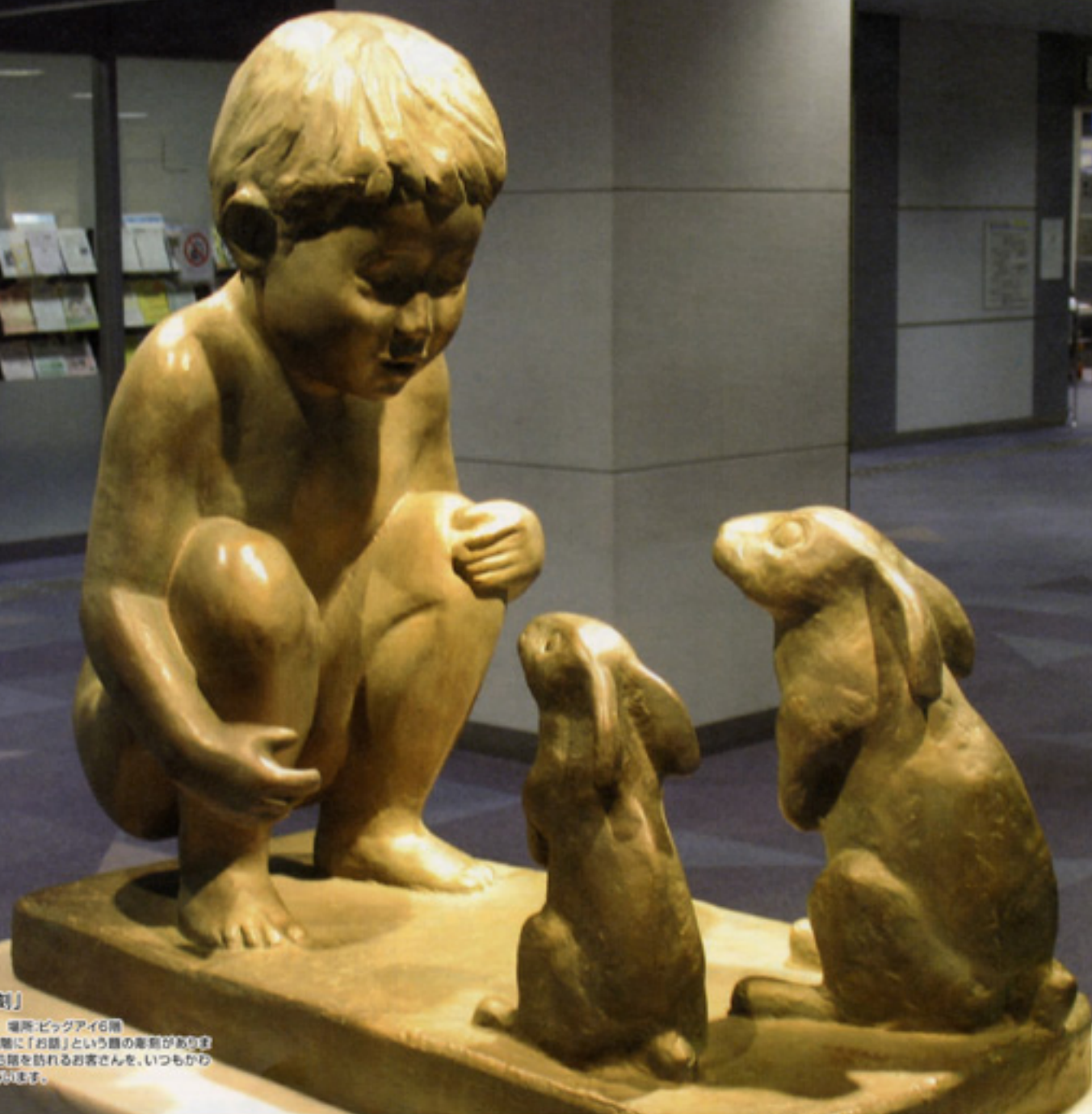
「郡山市にある彫刻」

【対話】 作・伊坂周 場所・ビッグアイ6階 郡山市にあるビッグアイ6階に「お話」という題の彫刻が展示されています。伊坂周氏が展示した6階を訪れるお客さんを、いつかから4階も4階までお出迎いです。