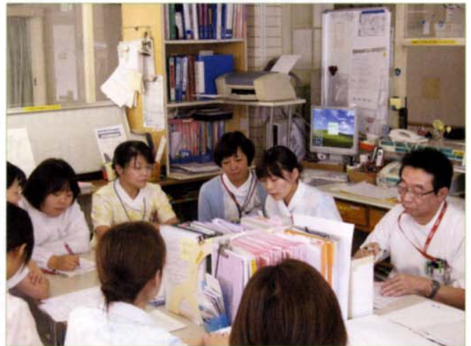
〈事例検討会の様子〉