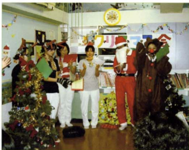
〈小児病棟クリスマス会の様子〉