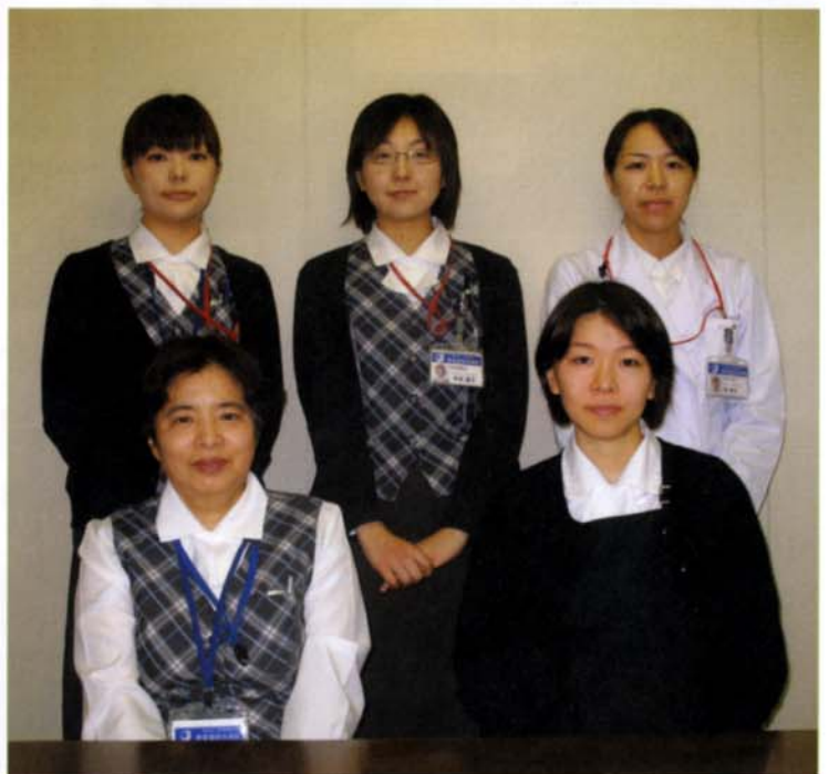
〈社会福祉課スタッフ〉