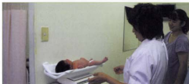
〈助産師外来の様子①〉