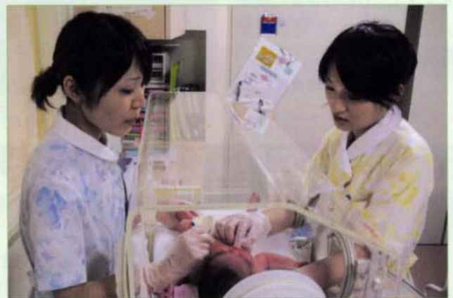
〈「保育器の使い方」の指導を受けているところです。〉