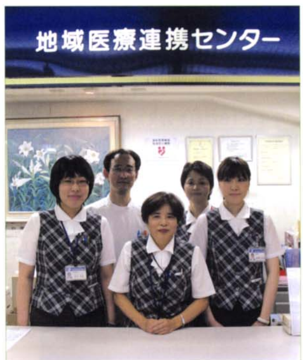
〈診療連携室スタッフ〉