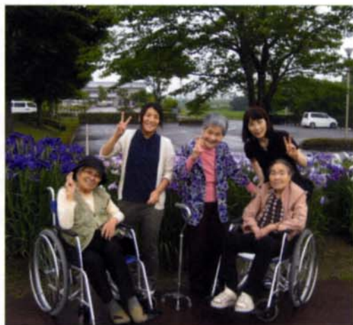
〈鳥見山公園でのひととき〉