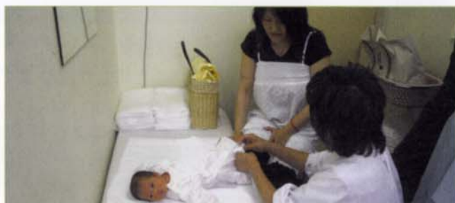
〈助産師外来の様子②〉