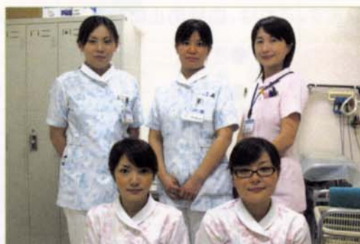
〈人間ドックアドバイザーのみなさん〉

(注1) 保険者とは、健康保険事業を運営するために保険料を徴収したり、保険給付を行ったりする運営主体のことを言います。 <〇〇国民健康保険、全国健康保険協会(旧政管健保)、〇〇健康保険組合、〇〇共済組合、〇〇国保組合など>