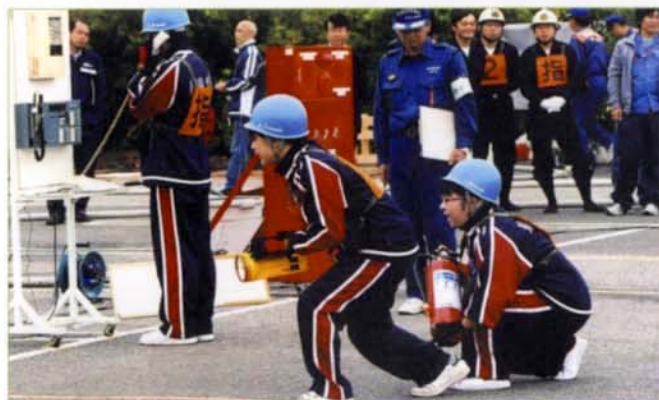
〈消防操法大会の様子〉