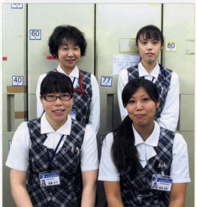
〈診療情報管理室スタッフ〉