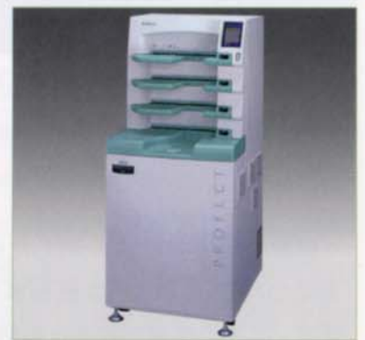
〈画像読取装置(FCR PROTECT CS)〉