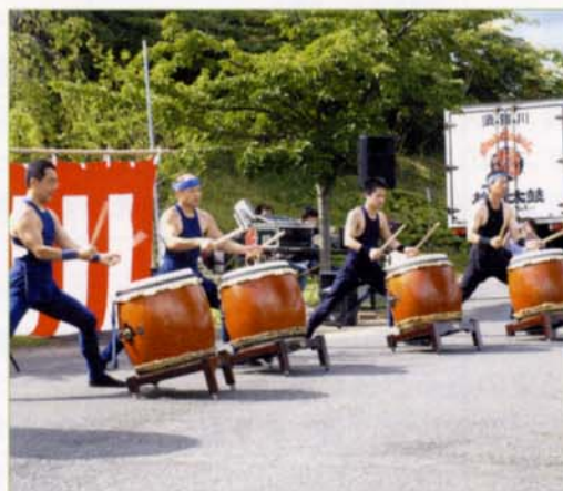
〈奥州須賀川松明太鼓保存会による演奏〉