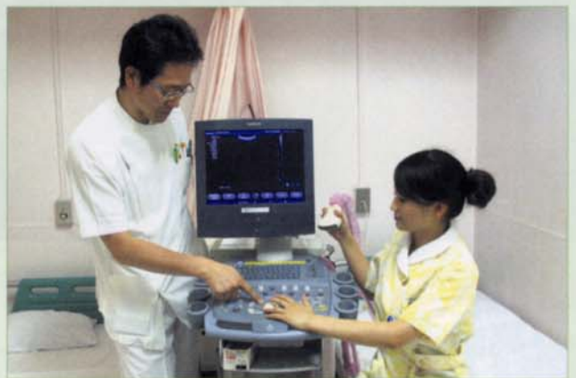
〈胎児超音波の勉強中!〉