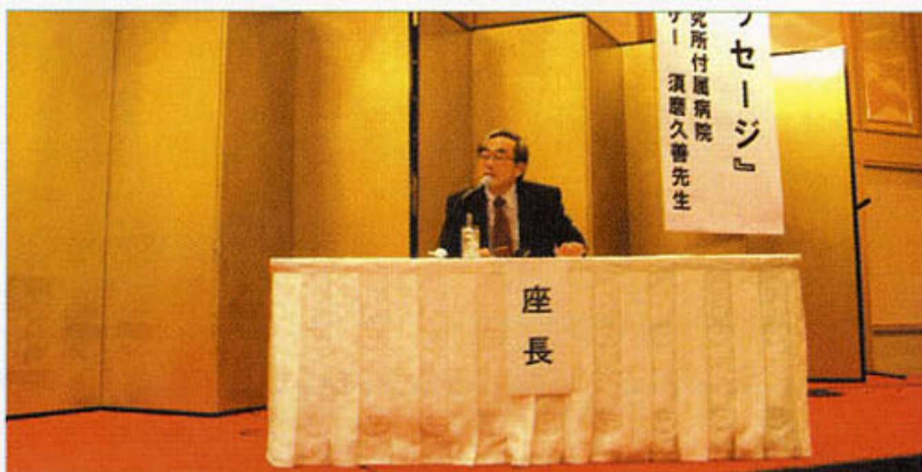
〈座長を務めた金澤寿泉堂総合病院長〉