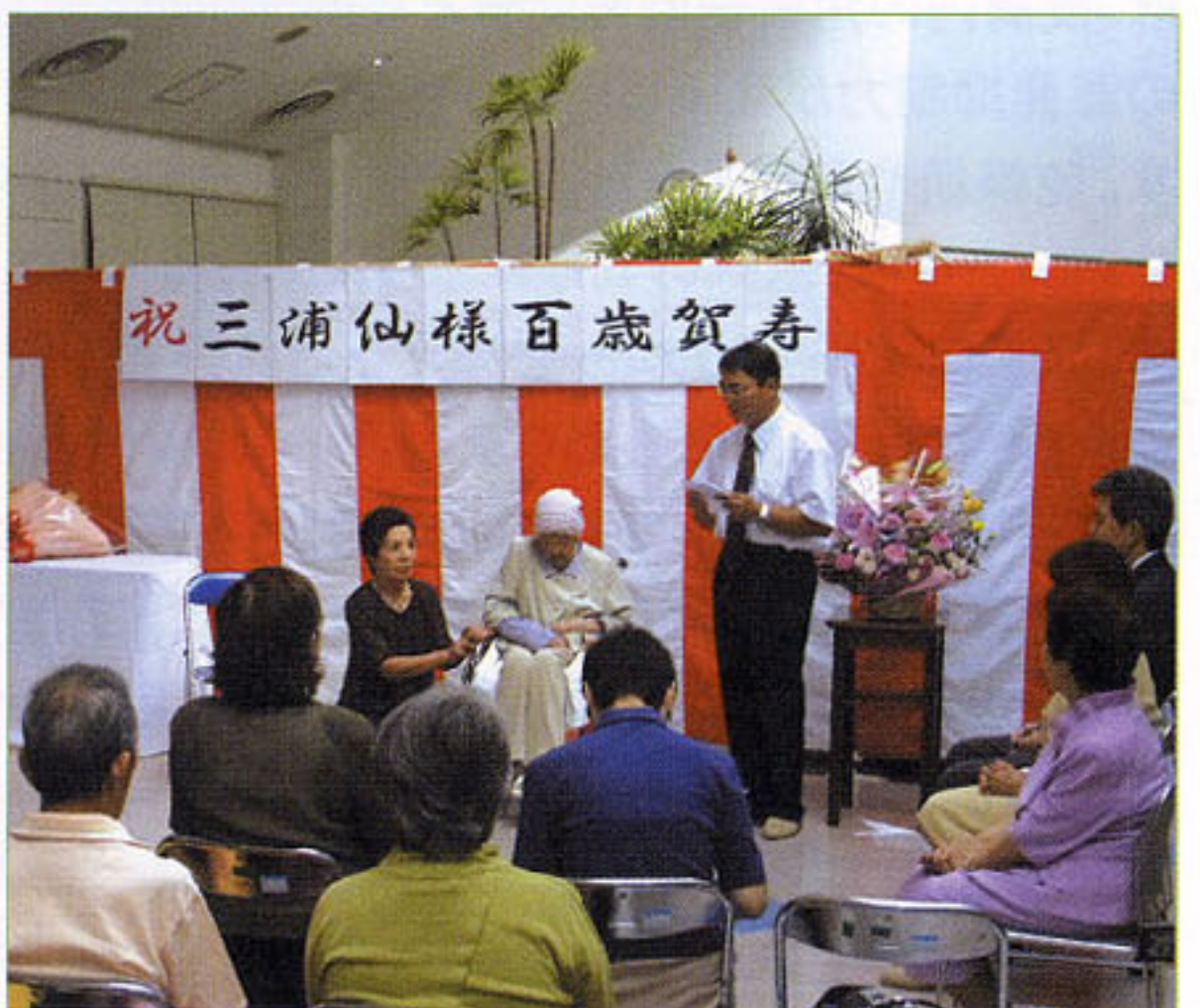
〈百歳賀寿贈呈式の様子〉