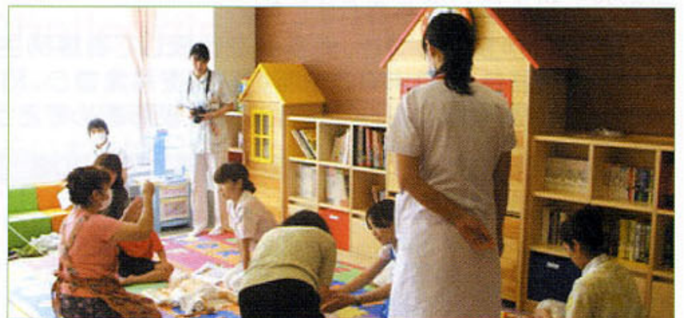
〈救急蘇生法の様子(小児)〉