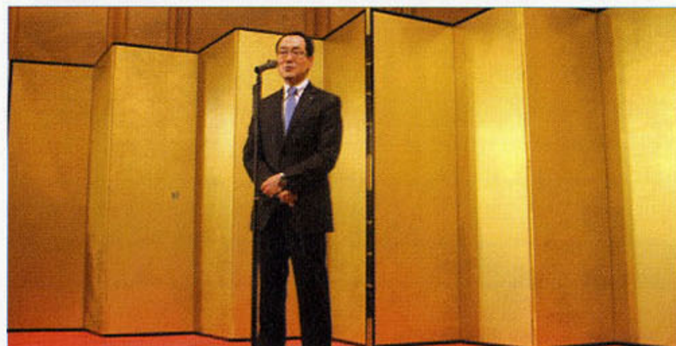
〈湯浅理事長によるあいさつ〉