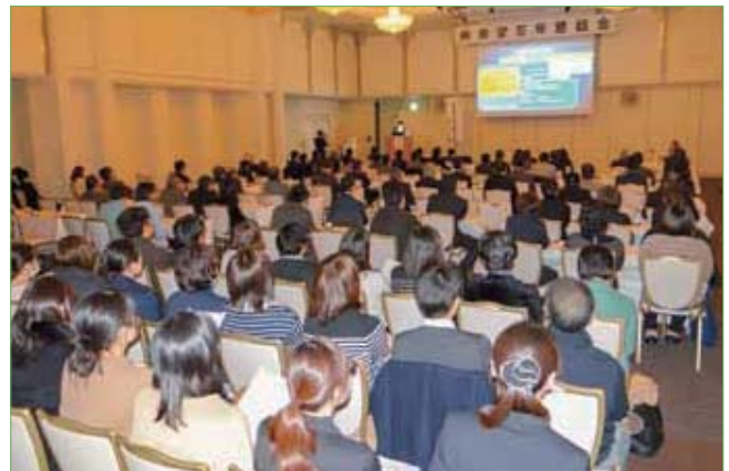
〈忘年懇話会の様子〉