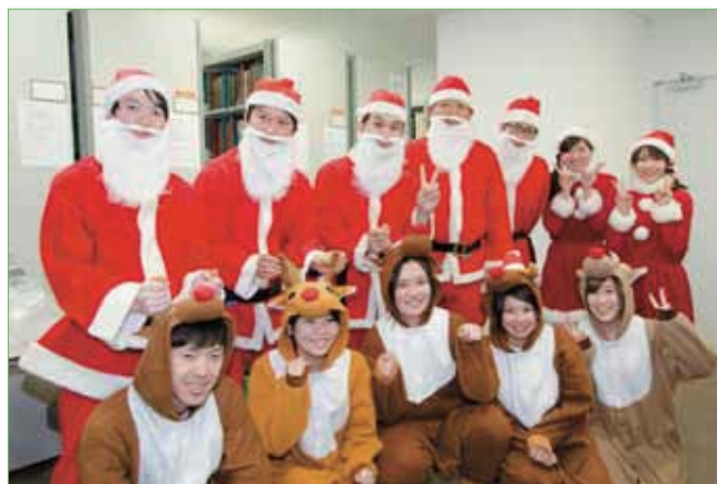
〈先生方のサンタクロース〉