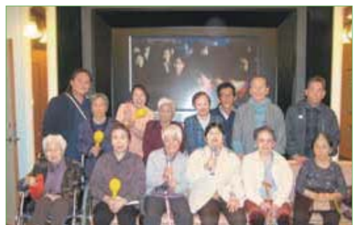
〈大スクリーンの前で皆さん一緒に!〉