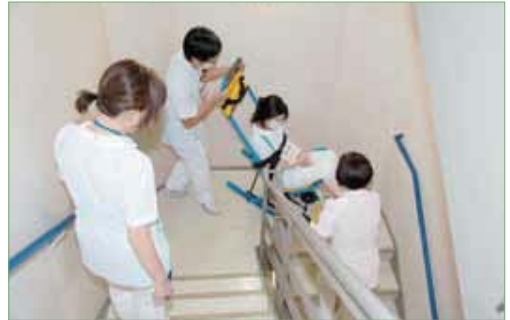
〈イーバックチェア搬送訓練〉