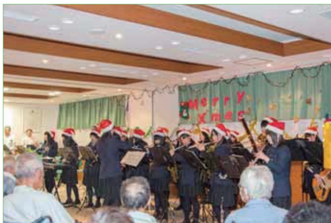
〈郡山東高校吹奏楽部の皆さん〉

昨年の12月10日(木)にクリスマス会を開催しました。入院患者さん約80名が参加しクリスマスソングの生演奏などで楽しいひとときを過ごしました。郡山東高等学校吹奏楽部員28名が「クリスマスハッピーメドレー」「世界で一つだけの花」「ジングルベル」「サウンドオブミュージックメドレー」など軽快な演奏を次々披露し、アンコールの声が出るなどとても盛況でした。またキャンドルサービスも行われ各階病棟の医師や看護師がサンタクロース、トナカイに扮し、各病室を回って入院患者さん一人ひとりに「メリークリスマス」と声をかけながら握手をし、クリスマスプレゼントを手渡しました。また一緒に回ったスタッフと撮影した記念写真を翌日お渡しし、とても喜んでいただきました。 (イベント委員 羽賀 貴子)