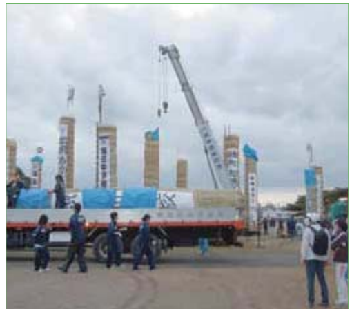
〈松明あかしの前日〉