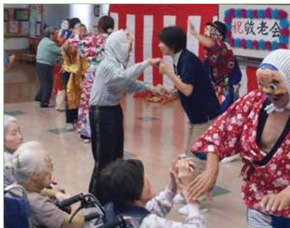
〈ひょっとこ踊りと利用者のふれあいの場面〉