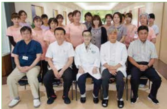
〈先生方とスタッフのみなさん〉

◎診療科：内科(一般内科・消化器内科・循環器内科) 外科(乳腺外科・甲状腺外科)