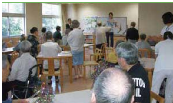
〈楽し木体操の様子〉