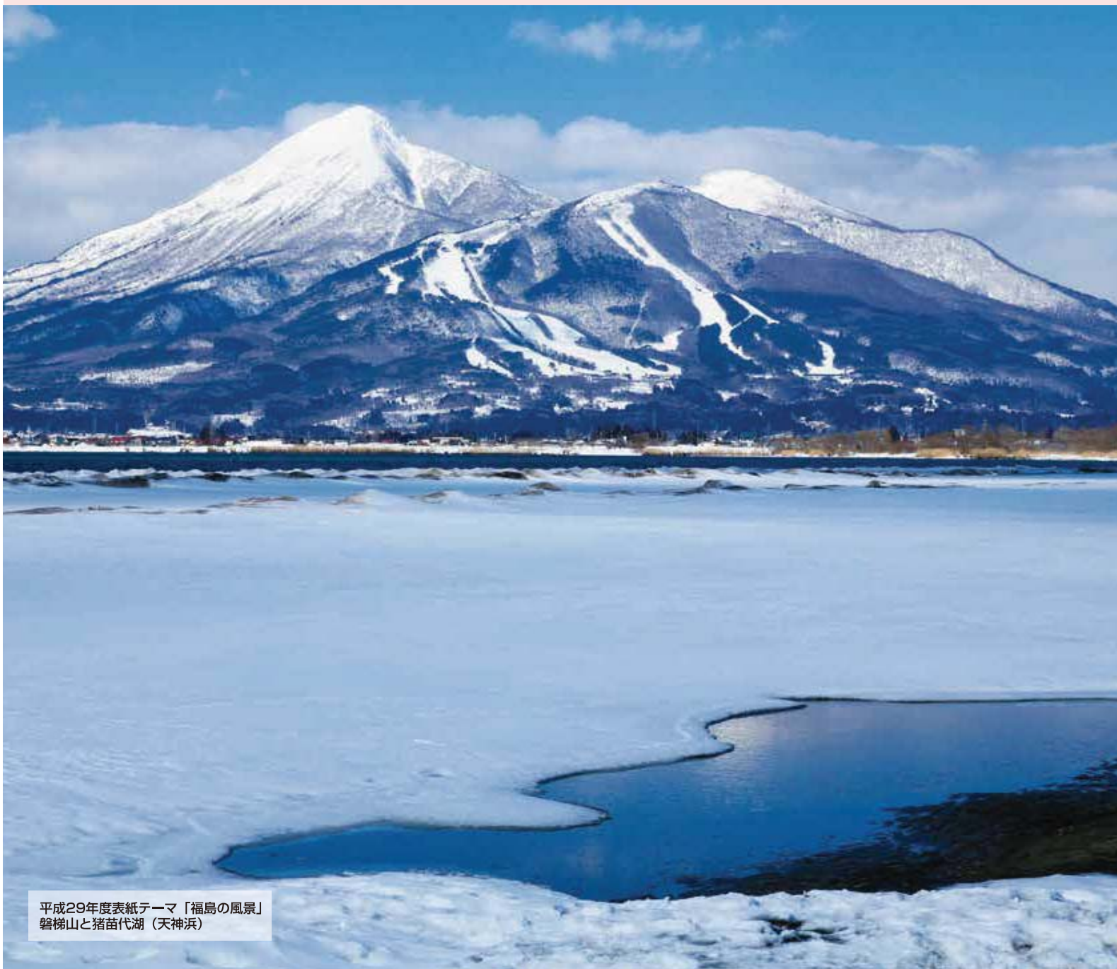
平成29年度表紙テーマ「福島の風景」 磐梯山と猪苗代湖（天神浜）